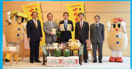
岸田総理と特産品PR