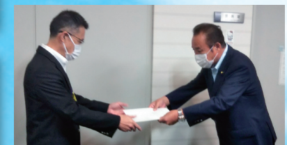
飲酒運転撲滅 (県意見書提出千葉県生活安全有害鳥獣担当部長)