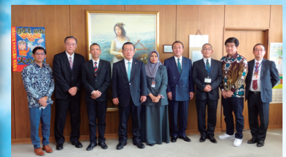
八街市国際交流協会