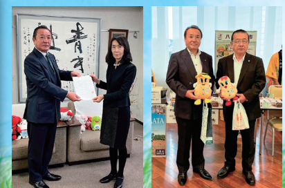
学校給食費無償化 (県意見書提出) 千葉県誕生150周年