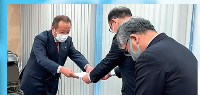
警察署への昇格 (県と県警意見書提出)