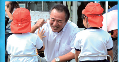
幼稚園の運動会 子どもたちと